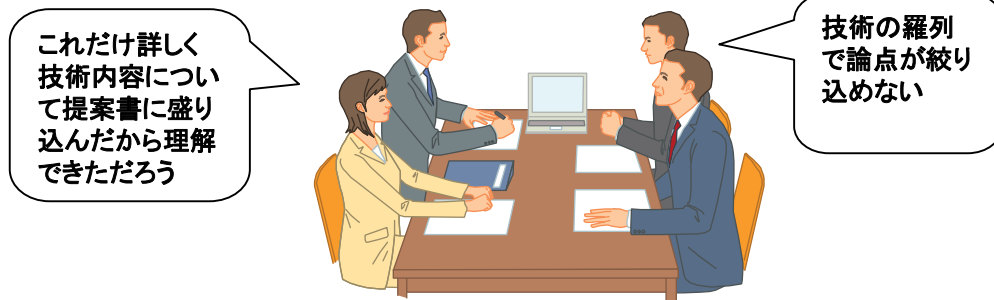
よく見受けられる技術者の提案風景